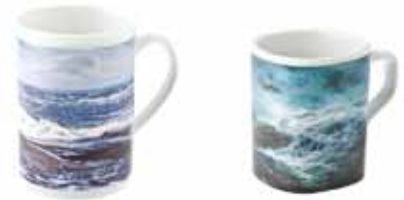
Sarjaan tulossa Meri-muki , konepestävä, kaksi mallia korkea ja matala (N:o 2, 3, 4, 9)