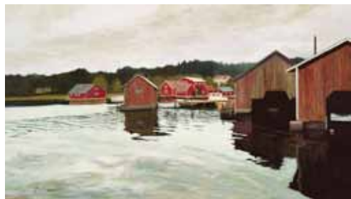
11. Rosala, Hiittinen - Rosala, Hitis