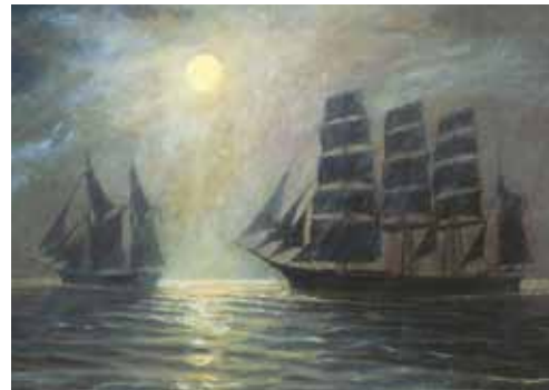
9. Kuutamolla - I månskenet