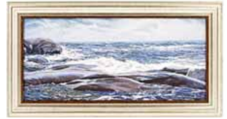
Venetaulu , 120,- n. 17 cm x 30 cm, hopea/kultakehys (N:o 1-13)