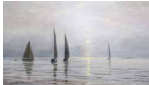
3. Pläkä - Bleke