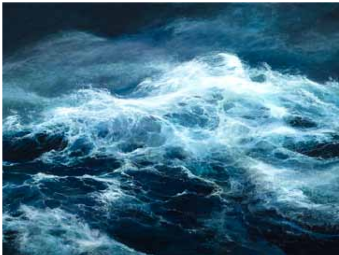
12. Itämeri - Östersjön