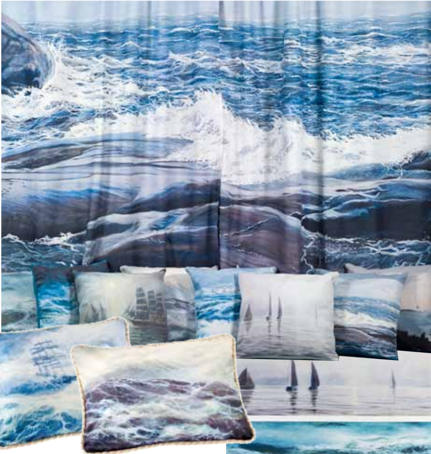
Meri-tyyny , 79,- 45 cm x 45 cm