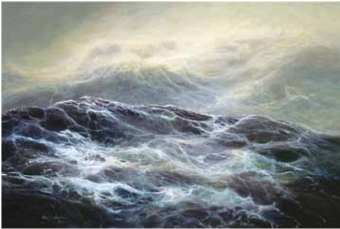
2. Äärimmäinen merenkäynti - Ytterst sjögång