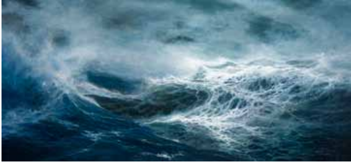
1. 12 boforia Porkkalanselällä - 12 bofor på Porkala fjärd