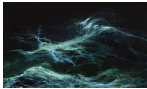
13. Merellä yöllä - Natt på havet