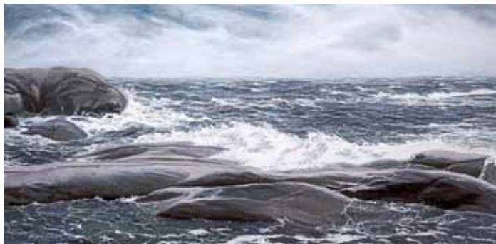
4. Bengtskärin rantapärsket - Bengtskärs strandsvall