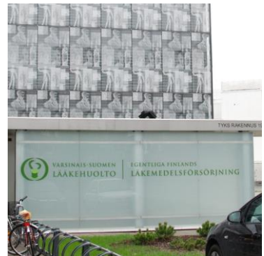
Varsinais-Suomen lääkehuolto käyttää MediCarGo vaunuja